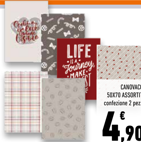
CANOVACCI 50X70 ASSORTITI confezione 2 pezzi