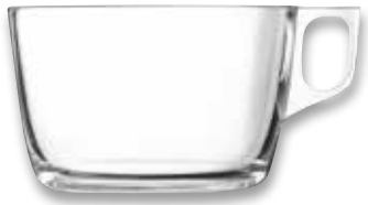
MUG IN VETRO linea nuovo 32cl