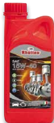
LUBRIFICANTE RHUTTEN 15W40 1L