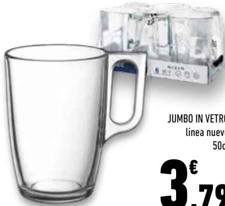
JUMBO IN VETRO linea nuovo 50cl