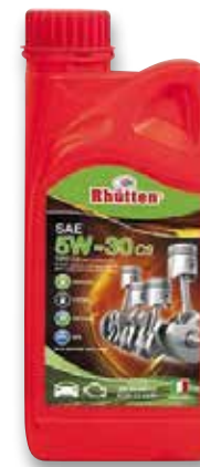
LUBRIFICANTE RHUTTEN 5W30 C3 1L