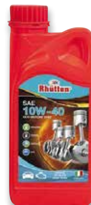
LUBRIFICANTE RHUTTEN 10W40 1L