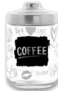
BARATTOLO IN VETRO SALE/ZUCCHERO/CAFFÈ