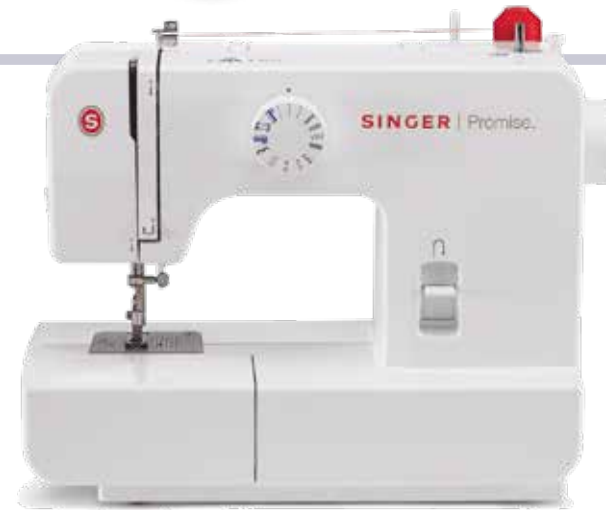
SINGER MACCHINA DA CUCIRE 14 operazioni di cucito, cucitura di rinforzo a ritroso, zig-zag ad ampiezza regolabile predefinita