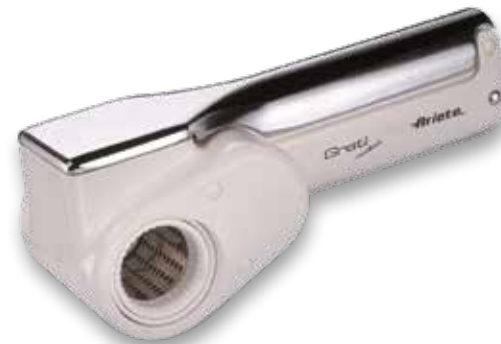
Ariete. GRATTUGIA ELETTRICA RICARICABILE GRATI acciaio inossidabile, dotata di n° 2 rulli, ideale per pane, formaggio, cioccolato, frutta, capacità della batteria 1500 mAh