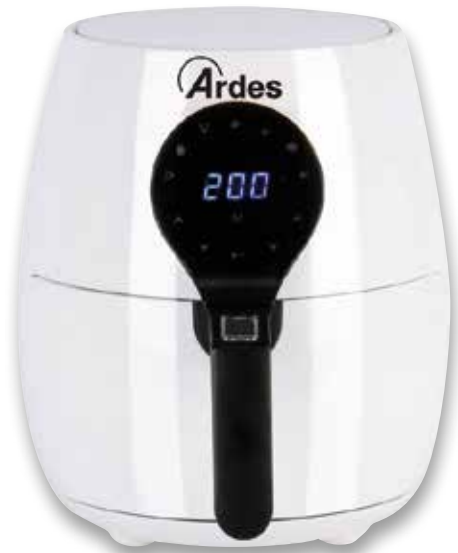
Ardes FRIGGITRICE AD ARIA capacità 5L, temperatura regolabile 80-200°C, timer fino a 60min, 7 programmi preimpostati