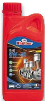
LUBRIFICANTE RHUTTEN 5W40 1L